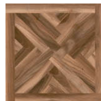
0541463 Noce Glam ■ 21 80x80 . 32"x32" rett