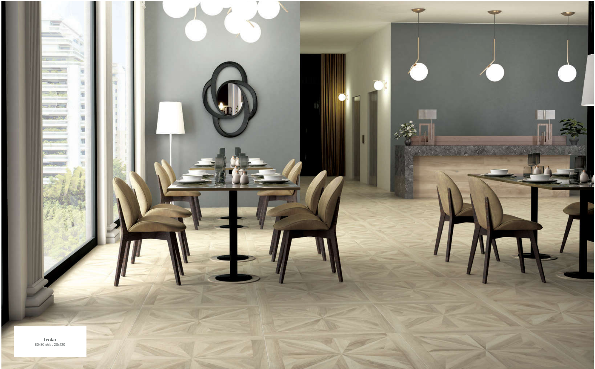
Iroko 80x80 chic - 20x120