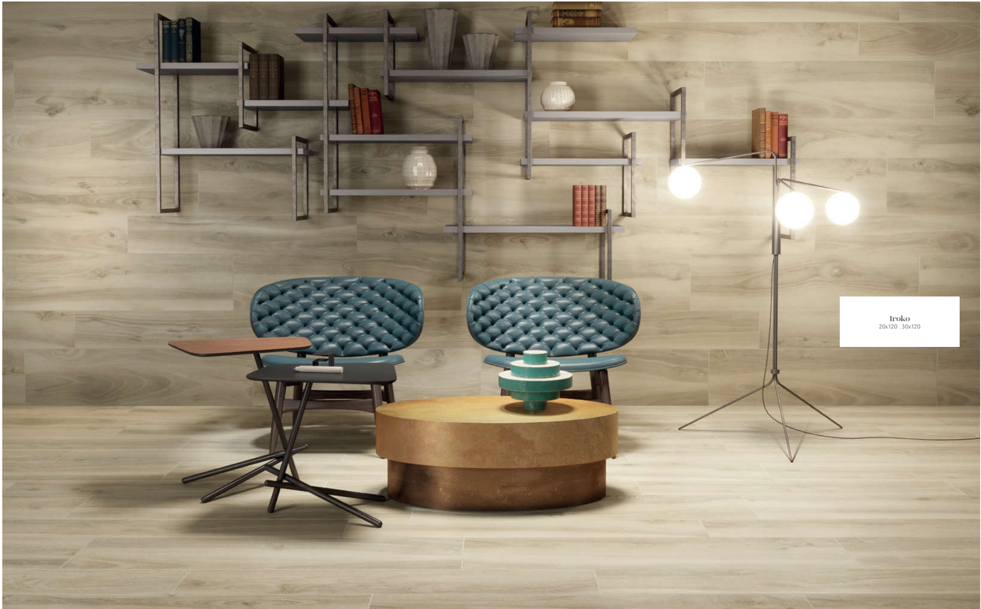
Iroko 20x120 . 30x120