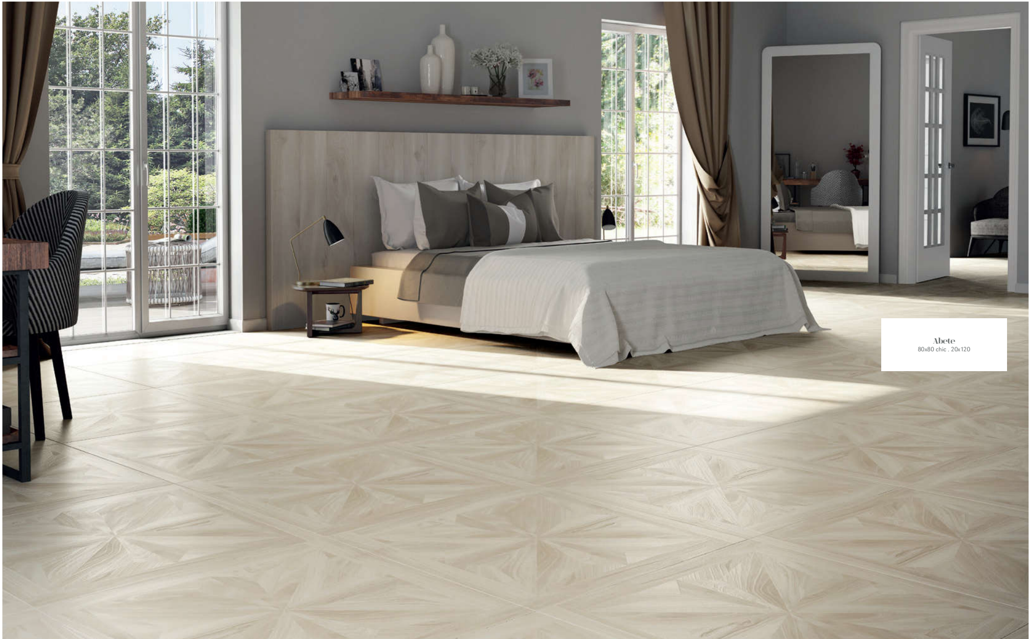
Abete 80x80 chic . 20x120