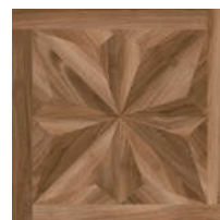
0541461 Noce Chic ■ 21 80x80 . 32"x32" rett