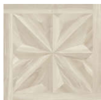
0541401 Abete Chic ■ 21 80x80 . 32"x32" rett