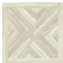
0541403 Abete Glam ■ 21 80x80 . 32"x32" rett