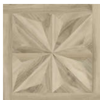
0541431 Iroko Chic ■ 21 80x80 . 32"x32" rett