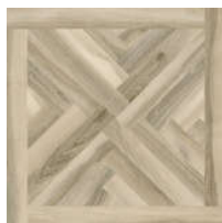
0541433 Iroko Glam ■ 21 80x80 . 32"x32" rett